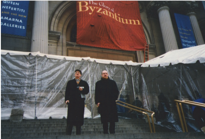
ნიუ-იორკი, მეტროპოლიტენ-მუზეუმი, გამოფენა „ბიზანტიის დიდება“, 1997